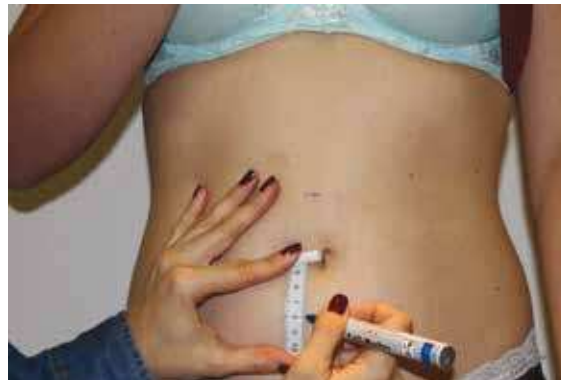
Fot. 1 Pomiar obwodu ciała

Do prawej strony brzucha pacjentki przyłożono 4 głowice o wymiarach 13 cm x 8 cm każda, co umożliwiło objęcie obszaru od prawego, tylnego talerza biodrowego do pępka. Głowice ustabilizowano specjalistycznym pasem elastycznym mocowanym za pomocą rzepa. Do najbliższych węzłów chłonnych (pachwinowych) przyłożono obustronnie głowice stymulujące, które ustabilizowano za pomocą plastra (fot. 2).