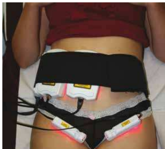
Fot. 2 Przykład mocowania sond zabiegowych

Do prawej strony brzucha pacjentki przyłożono 4 głowice o wymiarach 13 cm x 8 cm każda, co umożliwiło objęcie obszaru od prawego, tylnego talerza biodrowego do pępka. Głowice ustabilizowano specjalistycznym pasem elastycznym mocowanym za pomocą rzepa. Do najbliższych węzłów chłonnych (pachwinowych) przyłożono obustronnie głowice stymulujące, które ustabilizowano za pomocą plastra (fot. 2).